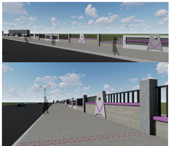
上圖 通學步道及新圍牆示意圖

本校中山南路校門口圍牆規劃拆除重建，並退縮圍牆約略 4 米，規劃增設寬敞的通學步道以利同學行走，相關經費已於去年度向國教署提送計畫並獲准補助 1000 萬工程款，該工程並向交通局申請公車站牌往西遷移至校門口左側、增設 T-bike 站點，也獲同意。至於人行道上的阿勃勒將會全數移植於