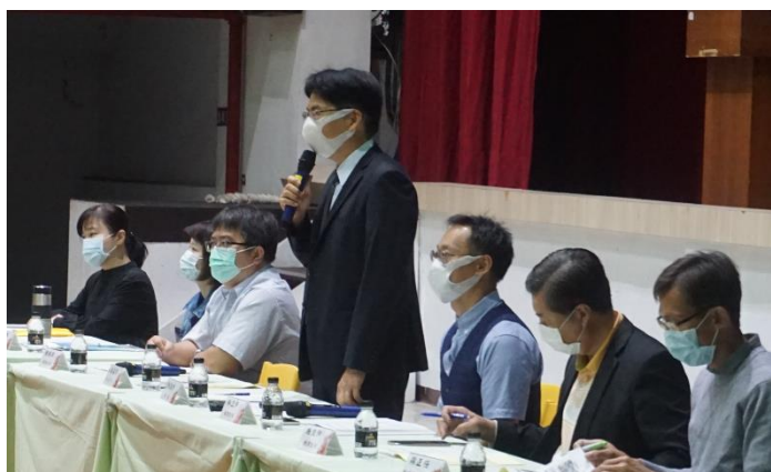
校長與各處室主任開場致詞