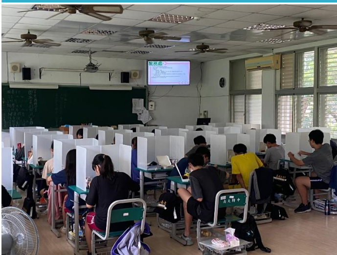
(下圖)學生用餐時段依規定使用隔板

開學迄今已經兩周了，學校的防疫措施也都遵照疫情指揮中心、教育部防疫指引及台南市政府的防疫規定，包含全時戴口罩、量測體溫、環境定時清消、