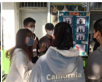
導覽員與學生介紹與聽障者互動的小技巧