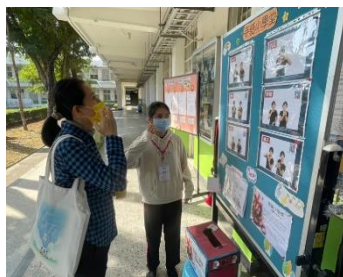
導覽員教導老師／學生各式水果的手語

障面對感情的心理狀態及與聽障互動交往的小細節，過程中幫助學生重新思考原來生活中理所當然的事情對聽障者來說卻如此不簡單，也學習用更敏銳的心重新檢視生活，如何將環境調整成適合所有人的樣子，這才是對每一位有特殊需求者（包含身心障礙者）的尊重。相信藉由聽障宣導的導覽及講座可以幫助師生們用體貼的心去溫暖周圍每一個人，讓我們一起散播幸福散播愛吧！