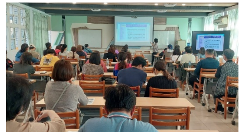
上圖為輔導處辦理高一選班群說明會

目前多元的升學管道，配合學習歷程檔案的準備，讓學生增加許多自我證明的機會，也鼓勵家長盡量能夠陪伴孩子探索世界，理解目前課綱、班群和未來考試招生的關聯性，才能理解孩子正在面對的生涯考驗，進而協助孩子做生涯決定。